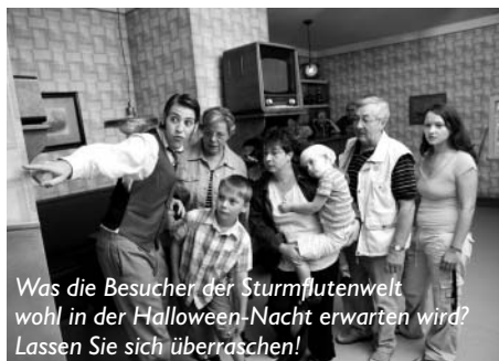
Was die Besucher der Sturmflutenwelt wohl in der Halloween-Nacht erwarten wird? Lassen Sie sich überraschen!

An diesem Abend läuft in der Sturmflutenwelt alles etwas anders als gewöhnlich und alles andere als ernst: Wer möchte, kann zum Beispiel seinen eigenen „Jack O' Lantern“, einen Kürbiskopf, schnitzen, sich gruselig schminken lassen, Gruselsounds lauschen oder am Kostümwettbewerb teilnehmen. Für große und kleine Hexen, Zauberer, Gespenster