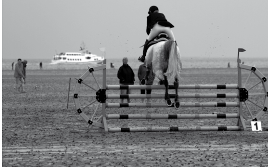
Solch ein Panorama bietet sich Roß und Reiter nicht jeden Tag