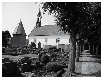
Die St. Marien-Kirche in Hemme