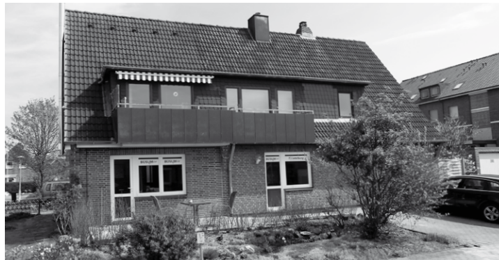
Unsere Redaktionsräume im Trischenweg – hier wollen wir mit Ihnen anstoßen

Es ist geschafft: Sie halten gerade unsere 1000. Ausgabe in den Händen. Davon hätten wir nie zu träumen gewagt, als wir das Projekt im Sommer 2005 starteten. 1000 Ausgaben in knapp sieben Jahren – das schafft man nur, wenn man das richtige Umfeld hat: Gute Leute, gute Leser, gute Inserenten, gute Freude und Förderer. Dafür möchten wir uns einmal persönlich bei allen bedanken, und mit Ihnen anstoßen bei unserem „Tag der offenen Tür“. Am Freitag ab 11:00 Uhr heißen wir Sie in unseren Räumen im Trischenweg 12 (Eingang Wattengrund) herzlich willkommen. Neben einem Gläschen Sekt