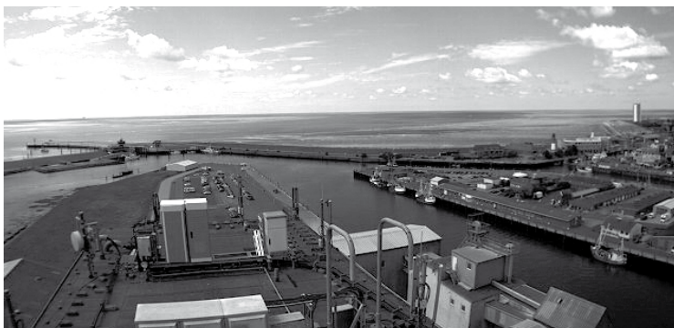
2007 Seit Mitte Juli gibt es die Büsum spontan-Webcam, die vom Stöfen-Silo aus einen Panoramablick über Deich und Hafen bietet www.buesum-spontan.de

Den entscheidenden Anstoß zu „Büsum spontan“ gab eine Hotelzeitung, auf die ich Anfang 2005 im Urlaub aufmerksam wurde. Kein Gast im großen Speisesaal des Hotels, der nicht in dem selbstproduzierten Blättchen las. So reifte in den folgenden Wochen die Idee heran, es in Büsum mal mit einer „Hotelzeitung für den ganzen Ort“ zu versuchen. Mit einer gemieteten Druckmaschine fing es im Sommer 2005 an und sollte zunächst einmal bis zum Ende der Sommerferienzeit dauern. Dann wollten wir sehen, was das Experiment gebracht hat. Hier einige Stationen unseres Blattes auf dem Weg zur 1000. Ausgabe.