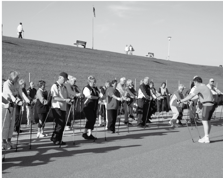
Aufwärmen und letzte Tipps bevor es auf die Strecke geht ...

Wie in den letzten drei Jahren findet auch dieses Jahr wieder während der Kohltage ein Nordic-Walking Lauf von Büsum nach Wesselburen statt. Der Hauptsponsor, die Kohlosseum GmbH, veranstaltet gemeinsam mit dem Tourismus Marketing Service (TMS) in Büsum und dem Kreissportverband Dithmarschen den Kohlosseum-KohlWalk 2012. Der A-Lauf über ca. 15 km startet am Samstag um 10 Uhr (Treffpunkt ca. 9.30 Uhr) vom Parkplatz am Gäste- und Veranstaltungszentrum nach