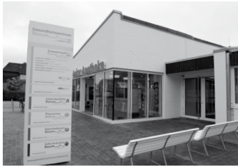
Die Praxis befindet sich im Gesundheitszentrum an der Westerstraße

In der Saison steht in Büsum eine Zentrale Anlaufpraxis für Notfälle außerhalb der Sprechstunden der Haus- bzw. Badeärzte zur Verfügung.