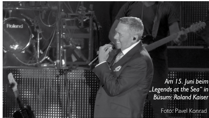
Am 15. Juni beim „Legends at the Sea“ in Büsum: Roland Kaiser