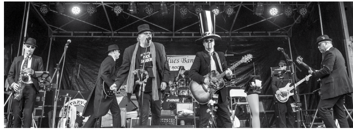
Die St. Jürgen Blues Band spielt schon am Vorabend des Gemeindefestes auf

ein buntes Treiben rund um St. Clemens: Neben herzhaftem und süßem Essen und Trinken eine Tombola, Musik zum Mitsingen und Zuhören, Volkstänze, einen Flohmarkt, eine Hüpfburg, einen Menschenkicker, Kinderschminken, Produkte aus fairem Handel, Handwerkskunst, unsere Büchergarage, Informationsstände und vieles mehr.