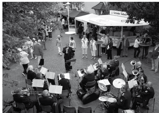
Buntes Treiben zwischen Kirche und Gemeindehaus beim Sommerfest „Bi Karkens to Gast“

Auch in diesem Jahr laden die St. Clemens-Kirchengemeinde Büsum und die Urlauberseelsorge Groß und Klein herzlich