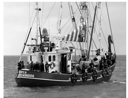
Schönster → wurde mit großem Abstand die „Andrea“ – geschmückt als Wikingerschiff