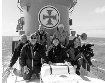
Die „Büsum-Spontan“-Leserjury an Bord der „Rickmer Bock“. Diesmal wurde die Arbeit der Jury von einem Fernsehteam begleitet