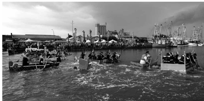
Start zum Papierboot-Firmencup – der Wolkenbruch kündigt sich schon an ...