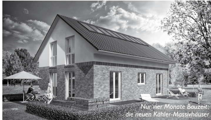
Nur vier Monate Bauzeit: die neuen Kähler-Massivhäuser

Wer an die Nordsee fährt, dem präsentiert sich am Eingang des beliebten Nordseeheilbades Büsum seit kurzem ein neues Bild: Das Bauunternehmen Kähler, 1921 gegründet und seitdem in Büsum zu Hause, baut am Ortseingang ein weiteres Musterhaus, das am Sonntag mit einem großen Fest eröffnet